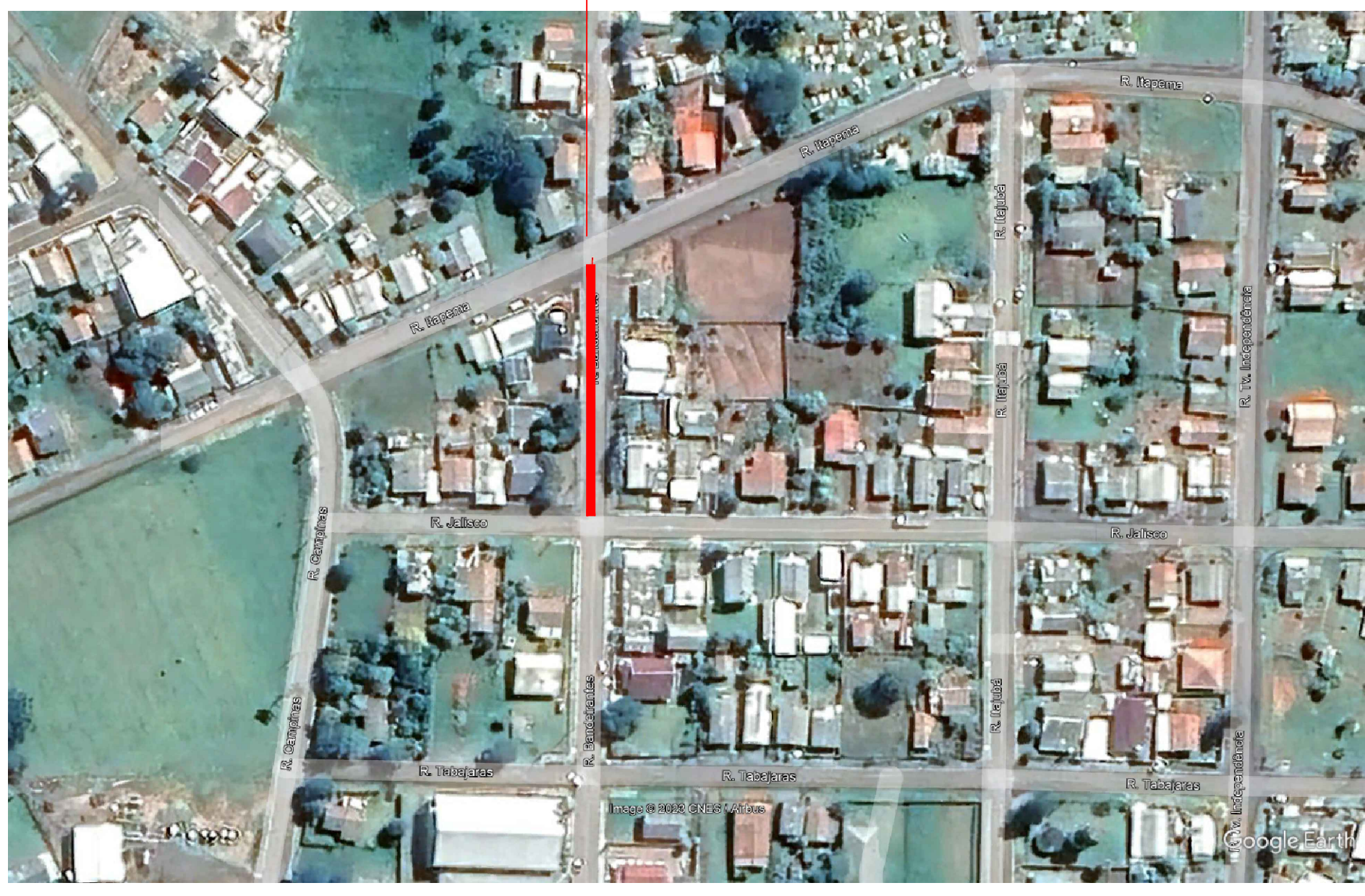
MAPA LOCALIZAÇÃO RUAS

PROJETO PAVIMENTAÇÃO RUA BANDEIRANTES ÁREA (71.00x8.00) 568,00m 2