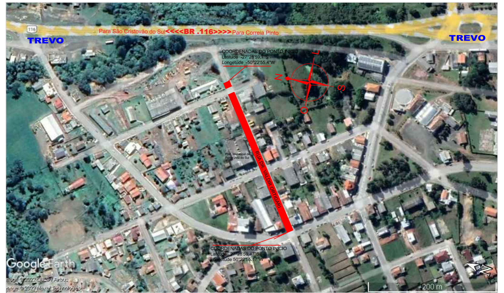
IMAGEM DO LOCAL SEM/ESC