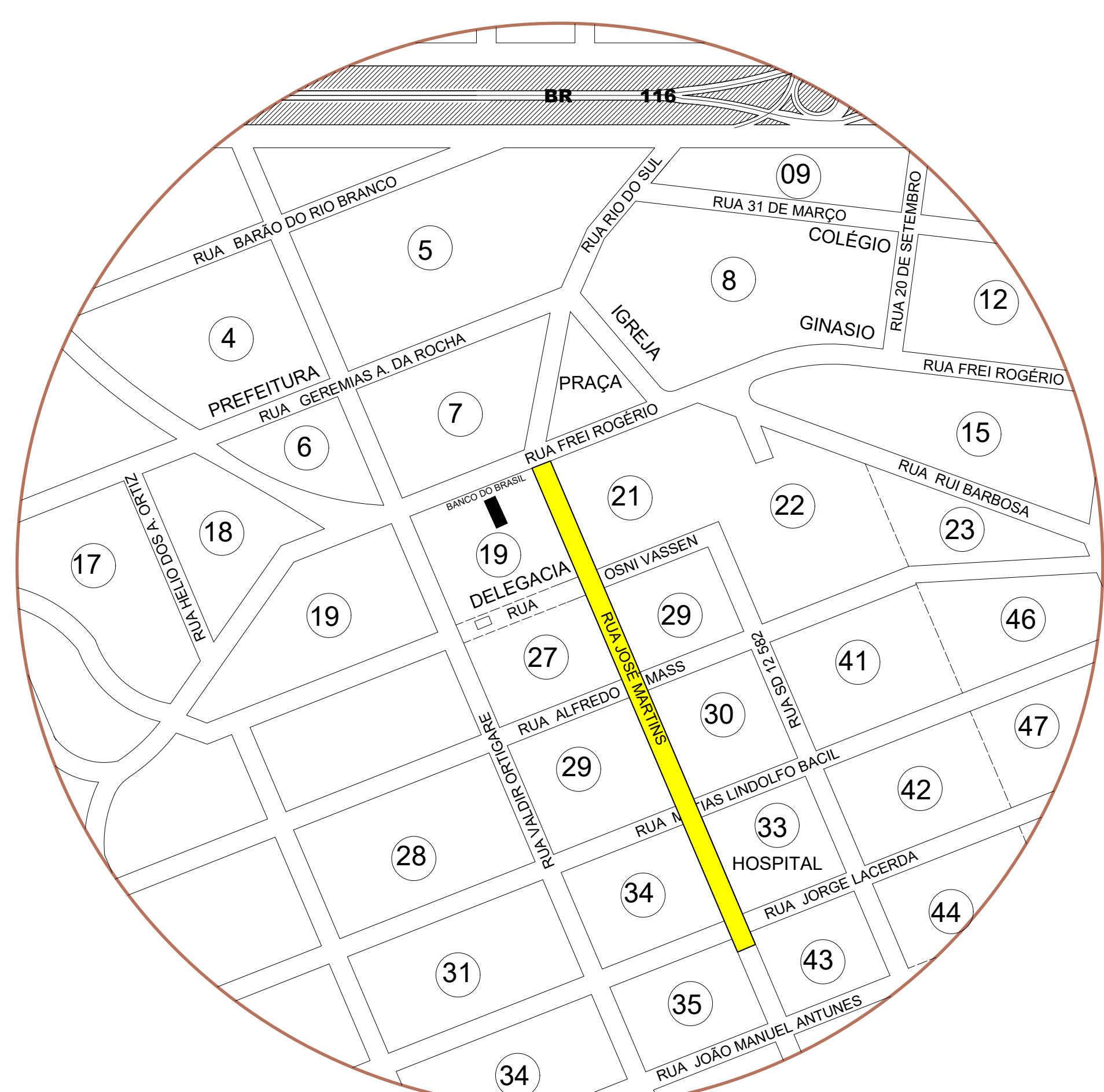
PROJETO SITUAÇÃO E LOCAÇÃO ESC 1/1000