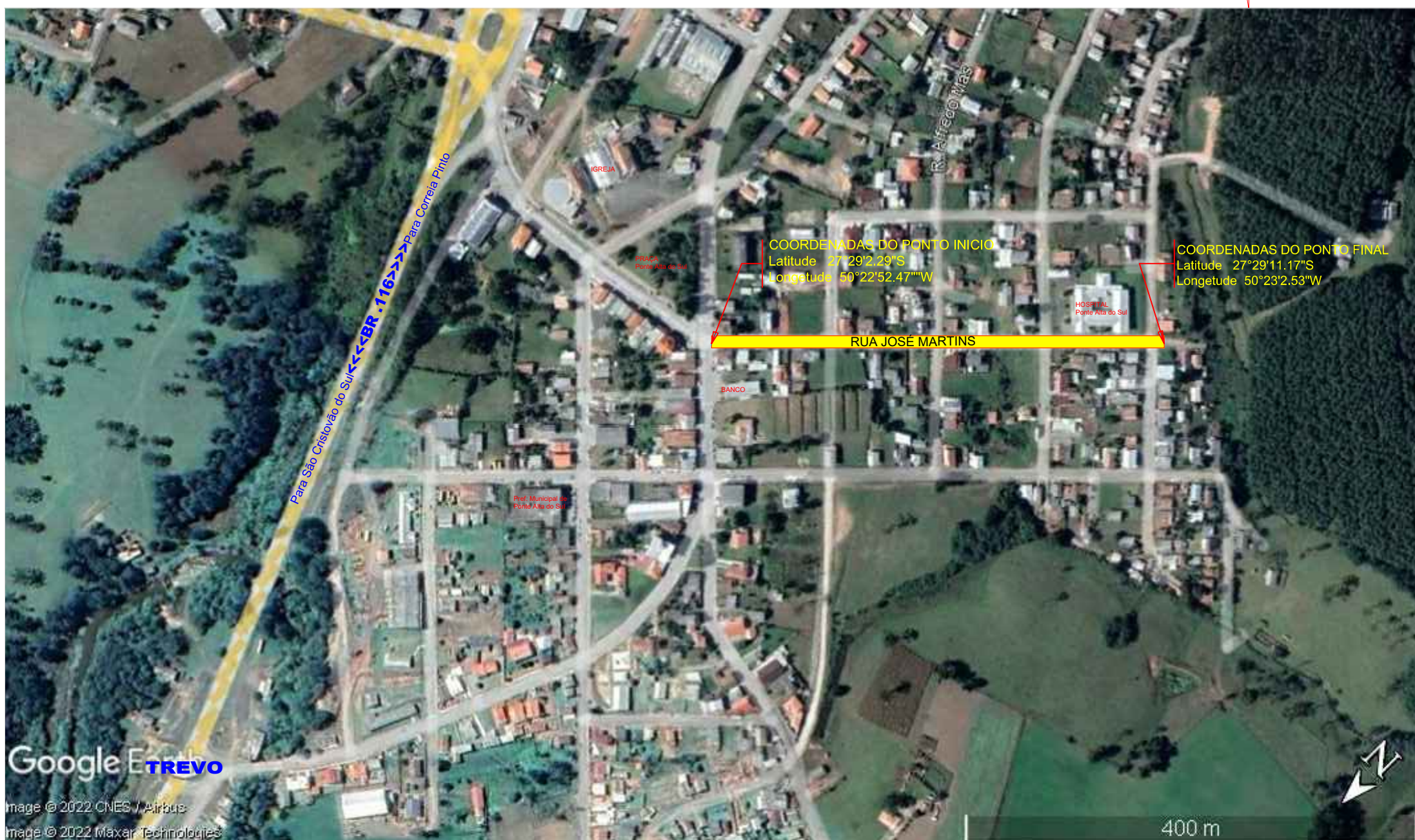
IMAGEM DO LOCAL SEM/ESC