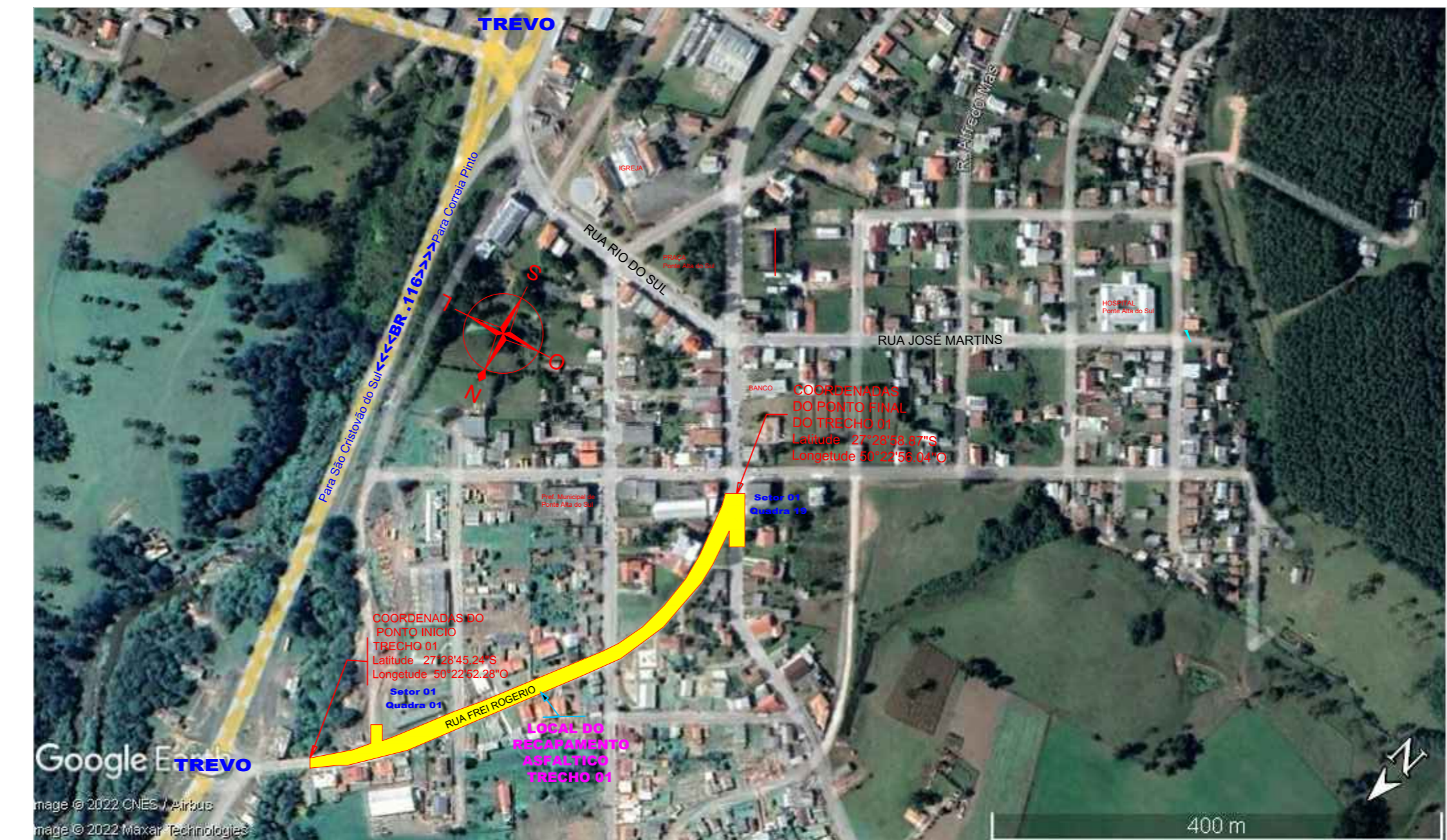
IMAGEM DO LOCAL SEM/ESC